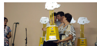
Projeto ADUEM Criança