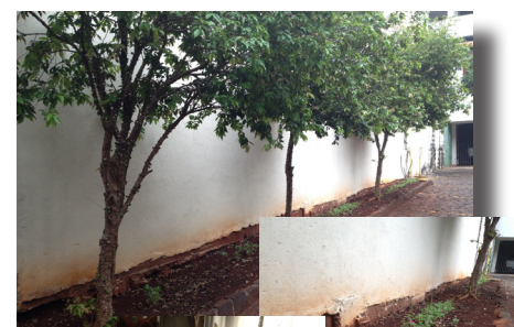
Foto do jardim antes das melhorias