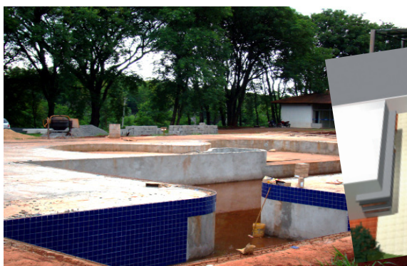
Perspectiva foto: Francisco Tambani

aos associados ainda nesta temporada de férias. A nova academia e a construção dos vestiários fazem parte da segunda etapa de ampliação da Sede Social. Há possibilidade de agregar outras melhorias, por isso é importante a participação dos sócios apresentando as sugestões.