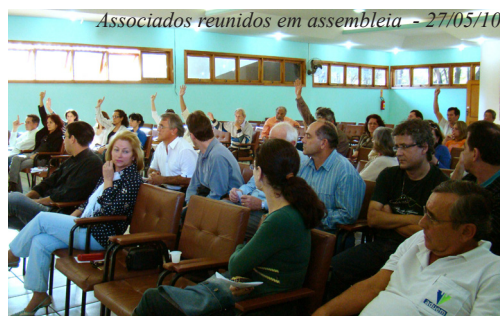
Associados reunidos em assembleia - 27/05/10

Durante este ano, algumas visitas estratégicas, bem como parcerias em eventos, foram realizadas