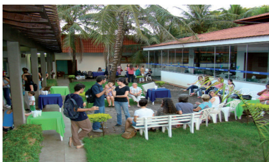
Homenagem Dia da Mulher - ADUEM 08-03-10

Durante o ano foram promovidos: quatro noites musicais; homenagem junina ao dia da mulher, dia do vínculo entre os docentes professor; jantar dançante das mães; costelada no dia dos pais e festa